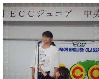
中学生 アンソロジーコンテスト