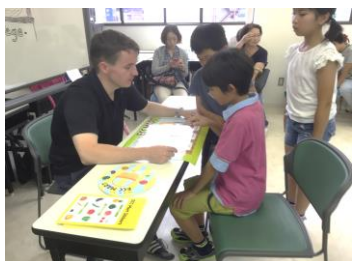
キッズサマーフェス