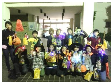
ハロウィンパーティー