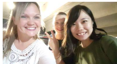
海外留学・ホームステイ

当教室は「英検」準会場登録校です。海外留学・短期ホームステイもしっかりサポート・アドバイス致します！！